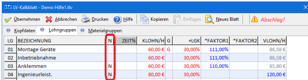
Abbildung 7: Kennzeichnung der Nachunternehmerlöhne im LV-Kalkblatt

Kennzeichnen Sie im Kalkblatt (F4) bei Lohngruppen die Nachunternehmerlöhne mit einem „N“ in Spalte N. Diese Lohnkosten sind VAR-Kosten und fallen nur an, wenn der Auftrag angenommen wird.